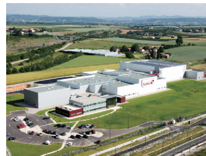
フランス ヴァランスにある工場

レヴェルジェ ボワロンの企業価値と専門性は代々受け継がれ、今もなお同族経営が行われています。現在の会長は3代目アラン=ボワロンです。あなたもレヴェルジェ ボワロンの冷凍ピューレ、冷凍クーリー、冷凍ホールフルーツから創造の可能性を探り、才能を開花させてください。