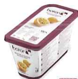
使用する ピューレと 牛乳の分量を 変えるだけ！ 無加糖 冷凍ピューレ パッション ●入数：1kg×6/ctn