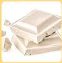
ホワイト チョコレート