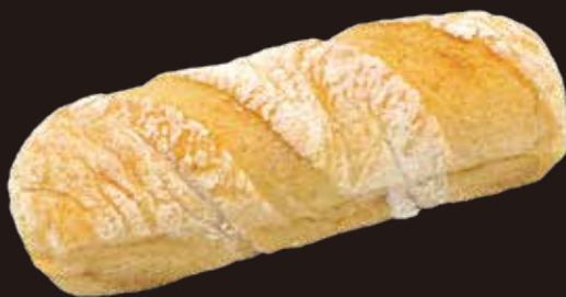
Mini bache ミニブッシュ 11405010