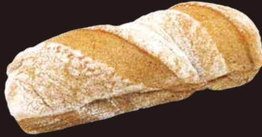
Mini bache seigle ミニブッシュ・セーグル 11405020