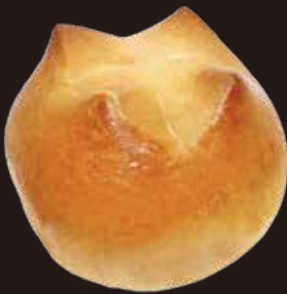
Brioche cube ブリオッシュキューブ 11403010