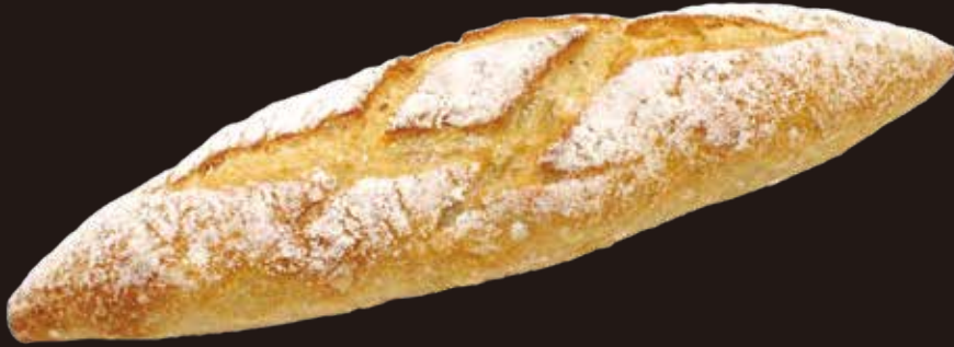
Mini baguette ミニバゲット 11401010