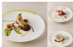
第 16 回入賞者作品

一皿の中にグラス（氷菓）を組み入れたデザールの腕を競う「グラス（氷菓）を使った第 17 回アシエットデセール・コンテスト」。弊社取り扱いのサンレミーブランデー XO60° が指定材料として使用されています。昨年より課題に加わった「ガストロノミー・ジェラート」も注目です！