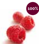
フランボワーズ (木苺)