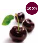
スリーズノワール (さくらんぼ)