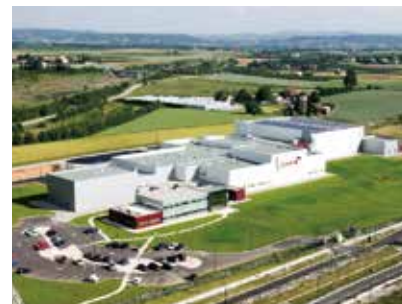
フランス ヴァランスにある工場

レヴェルジェ ボワロンの企業価値と専門性は代々受け継がれ、今もなお同族経営が行われています。現在の会長は3代目アラン=ボワロンです。あなたもレヴェルジェ ボワロンの冷凍ピューレ、冷凍クーリー、冷凍ホールフルーツから創造の可能性を探り、才能を開花させてください。